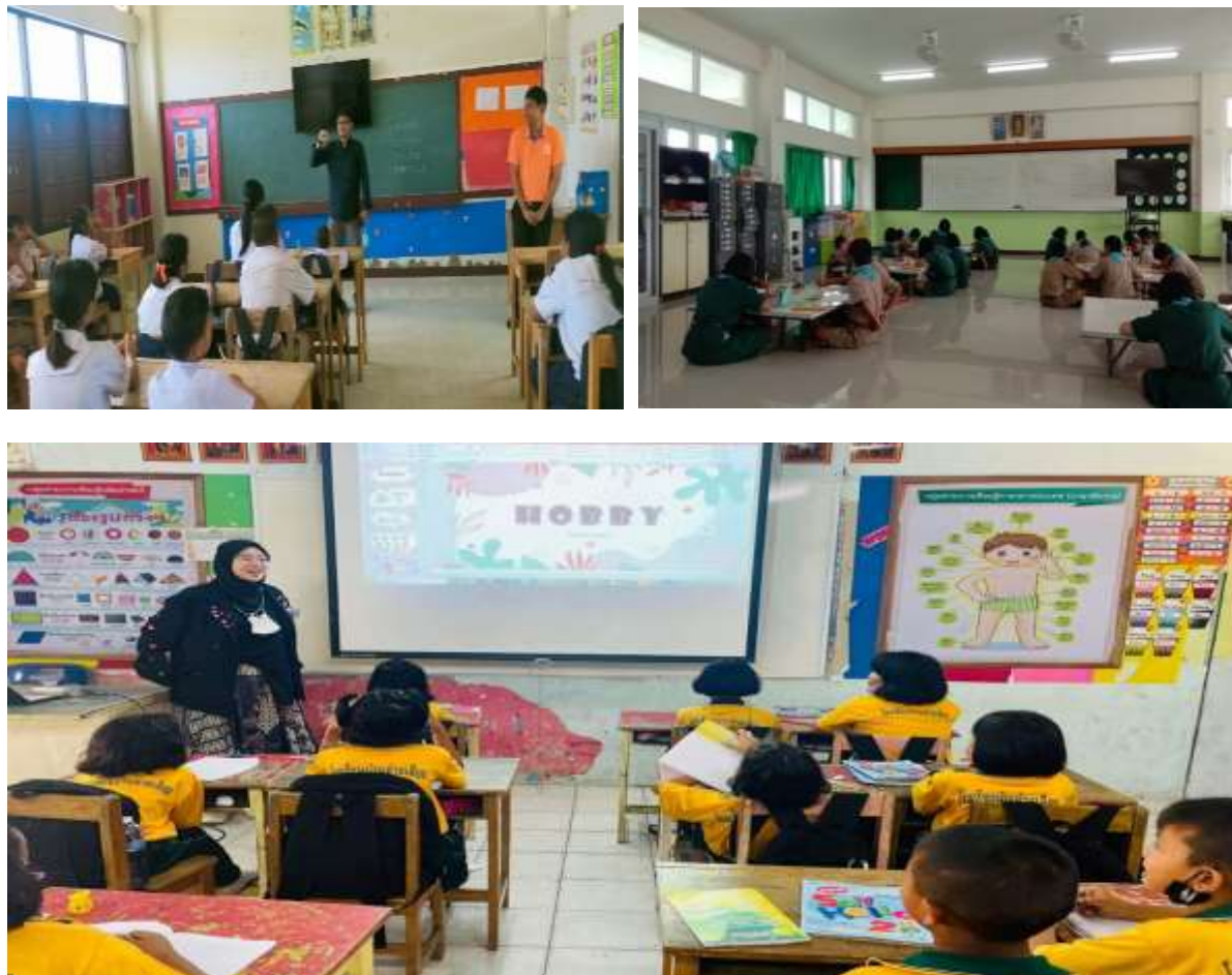
Gambar 1. Kegiatan Pelaksanaan Pelatihan Penggunaan Aplikasi ELSA.

Elsa dapat menjadi berbagai macam media, media pendukung dan alat peraga bagi para pendidik dalam pengajaran di kelas. Tidak hanya dapat mendengar cara siswa mengucapkan kalimat dalam bahasa Inggris, Elsa juga dapat memberikan penilaian langsung terhadap kesalahan pengucapan serta memberikan feedback yang sangat detail. Aplikasi Elsa-Belajar Bahasa Inggris Berbicara sangat membantu siswa yang ingin belajar bahasa Inggris secara fleksibel dimanapun dan kapanpun.